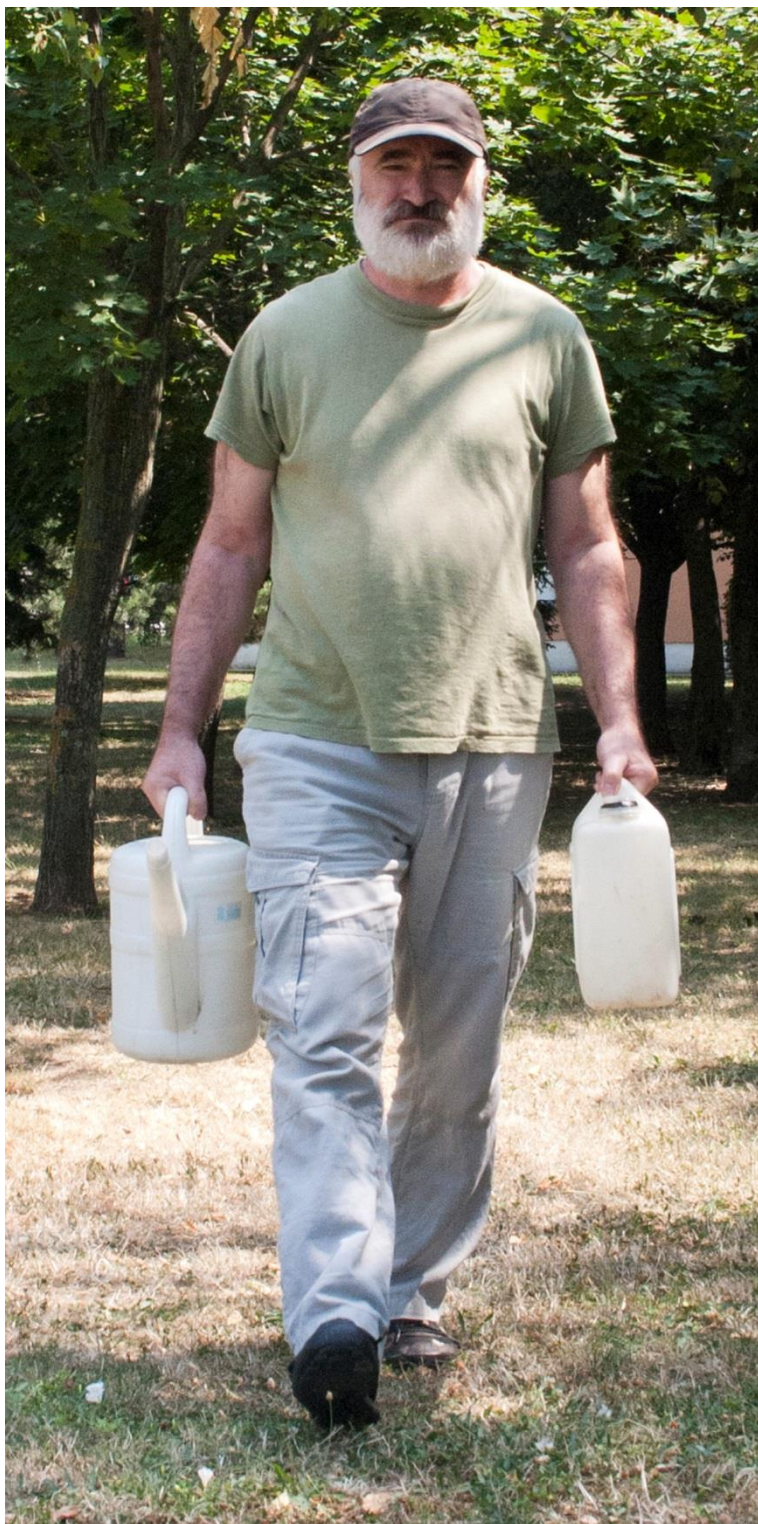
Blažej Baláž: My Way-My Revolution, 2015, 189 x 90 cm