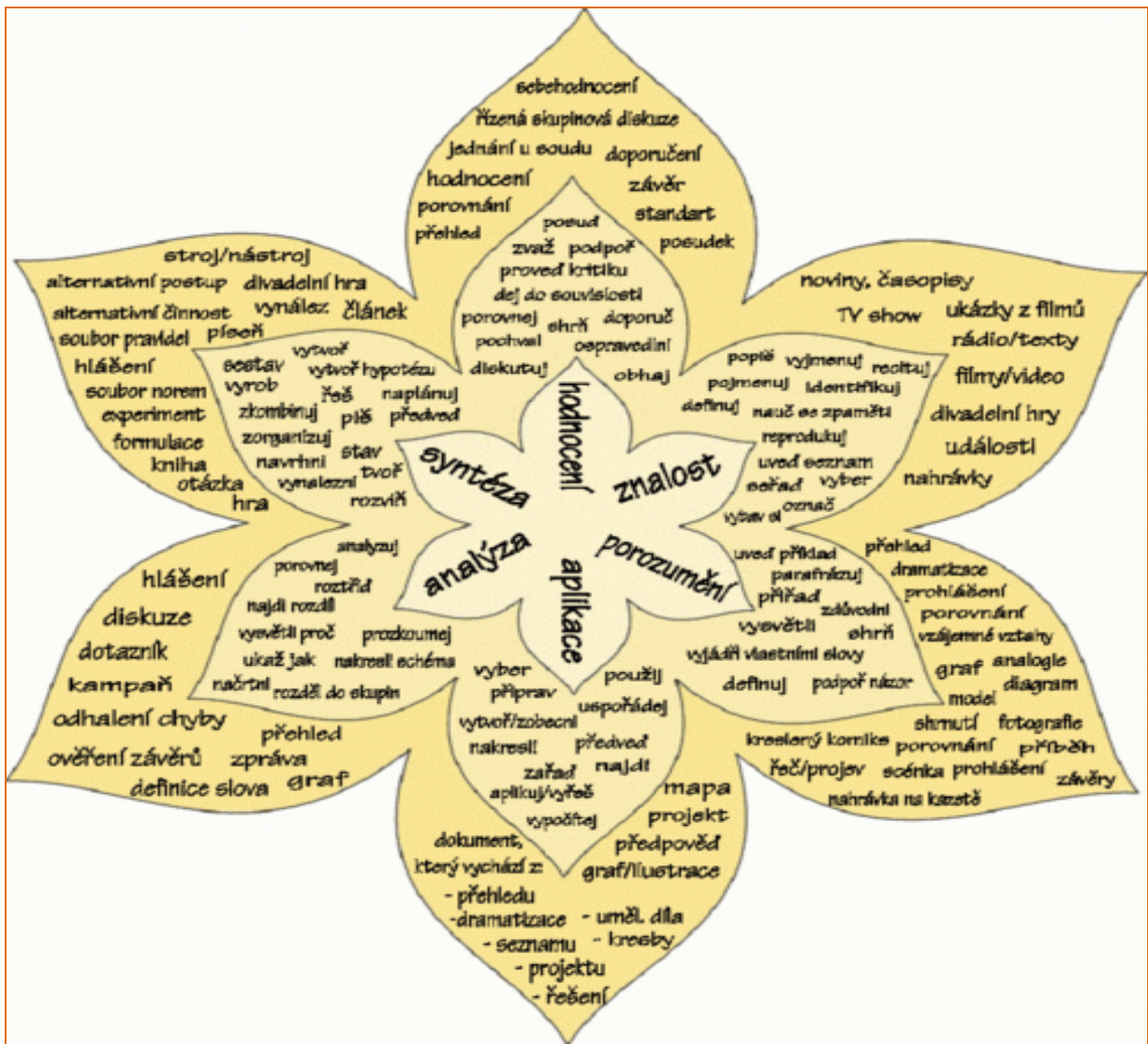
Obrázok 1 Bloomova ruža

Taxonómie vzdelávacích cieľov predstavujú užitočný nástroj pre učiteľa. Zdieľame názor, že aj pôvodná Bloomova taxonómia môže učiteľovi pomôcť zistiť, či sú jeho požiadavky vyvážené, či požiadavky vo vzťahu v učivu nie sú iba na nižších úrovniach. Usporiadanie kognitívnych funkcií do istej hierarchie podľa zložitosti funkcií pomáha učiteľovi budovať úlohy a cvičenia na výstavbu týchto funkcií.