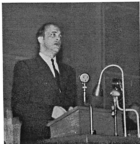
Dr. Oldřich John, předseda Národního shromáždění