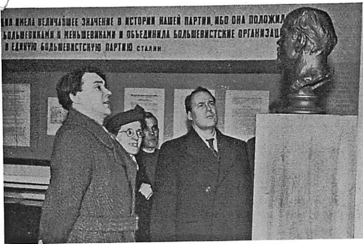
Sovětská delegace v Leni- nově síni Lidového domu v Praze