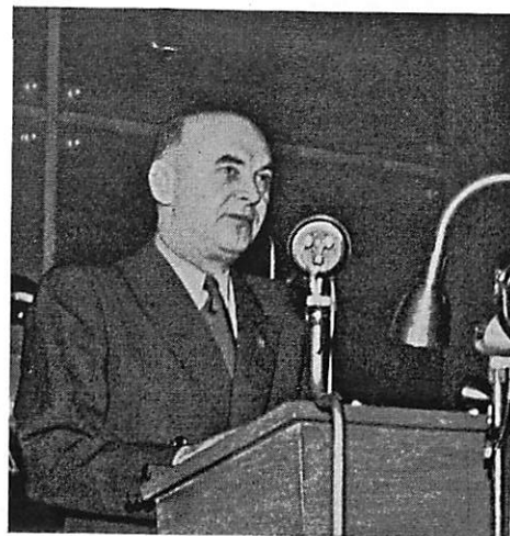
Václav Kopecký, ministr informací a osvěty