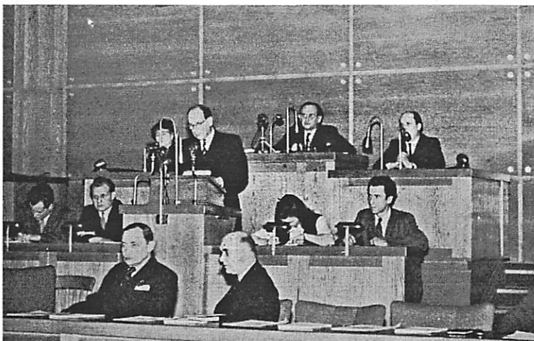
Projev předsedy vlády Ant. Zápotockého