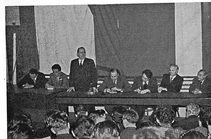
Sovětská delegace při přednášce na filosofické fakultě Karlovy university