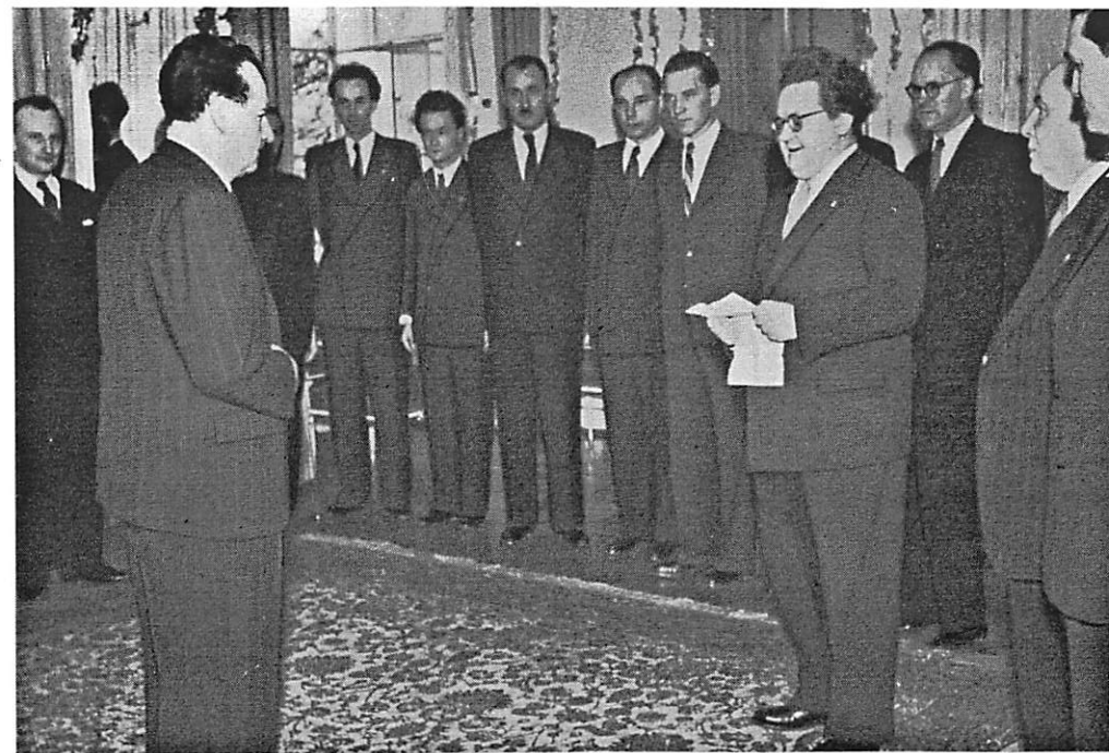
Delegace Sjezdu československých spisovatelů, vedená J. Drdou, u prezidenta republiky Klementa Gottwalda